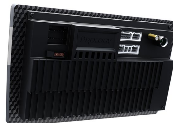
MPA-130 /135 DSP

Prology MPA-130 DSP и MPA-135 DSP – оптимальный выбор для систем в минимальном бюджете, но с возможностью лёгкой кастомизации интерфейса и установки базовых приложений из Google Play Маркет.