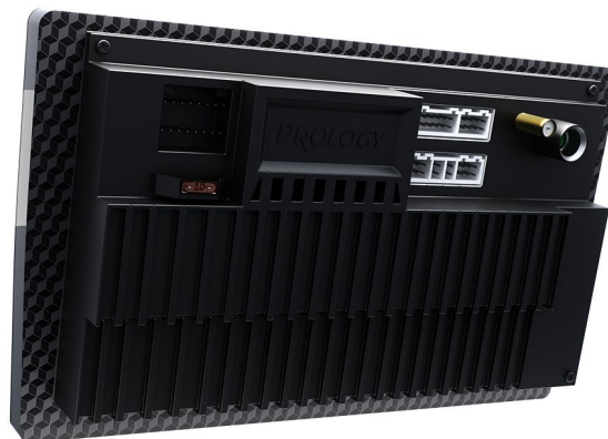
MPA 130/135, вид сзади