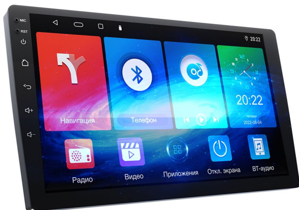
MPA 130/135, вид спереди